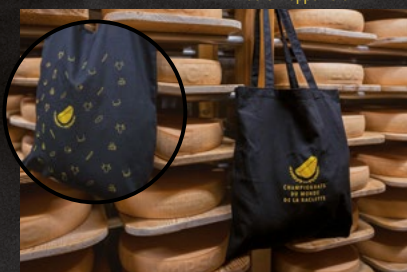
Shopper 5 CHF