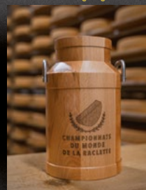
Isovin 129 CHF