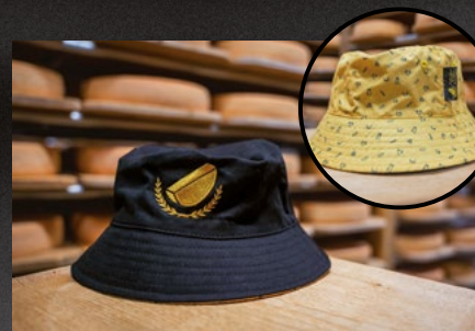
Bob-Hut, beidseitig tragbar 20 CHF