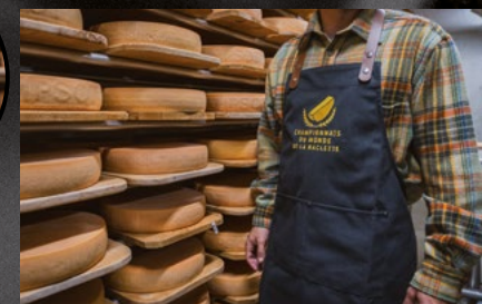
Schürze mit Lederträger, 65 CHF