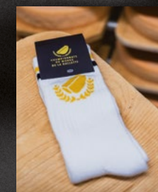
Socken 15 CHF