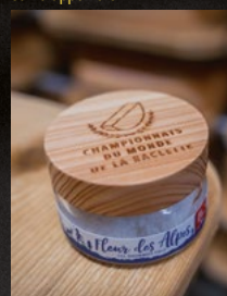
Salzglas aus den Minen in Bex 15 CHF