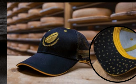
Trucker Kappe 20 CHF