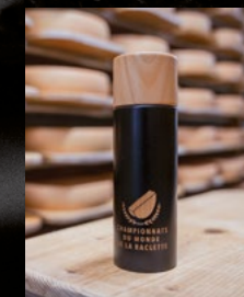
Pfeffermühle 60 CHF