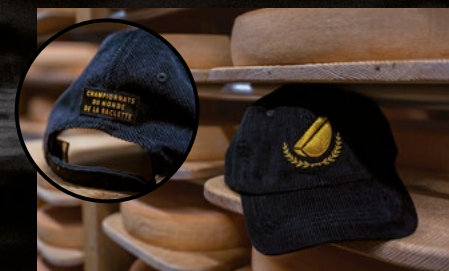
Samtkappe 20 CHF