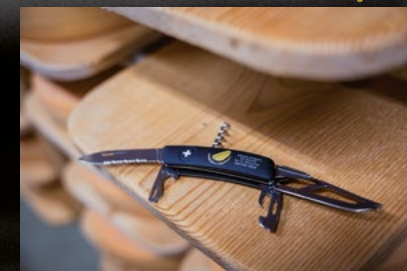
Schweizer Taschenmesser 65 CHF