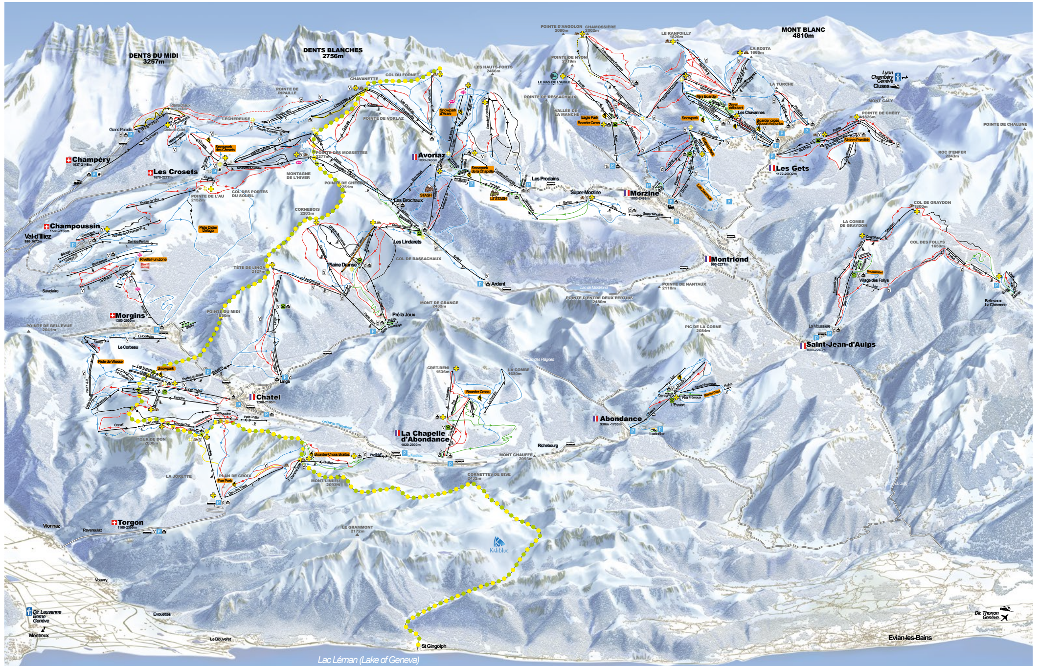
Lac Léman (Lake of Geneva)